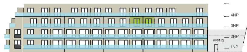
Západní pohled na dům / Building View - west side